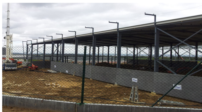
Unidade em construção DIGIDELTA—Parque de Negócios Torres Novas

no Parque beneficiarão de isenção de IMT na aquisição do lote e isenção de IMI durante 10 anos. Estes benefícios fiscais são exclusivos das Áreas de Localização Empresarial.