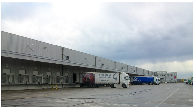
Entrepósito Logístico LIDL—Parque de Negócios Torres Novas