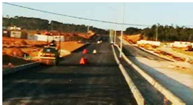
Setembro de 2010 - Conclusão da 1ª fase

Agro-industrial, metalomecânica, reparação de equipamentos, panificação, alumínio, são os sectores a que pertencem os projectos